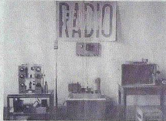
Il primo 'studio' di Radio Ferrara

«Un'idea non facile da realizzare — ricorda Moretti —, perché a quei tempi c'era il monopolio della Rai e impiantare un trasmettitore abusivo significava avere il giorno dopo la Finanza a casa». A soli due giorni dal processo le autorità cittadine, messe sotto pressione dalla stampa guidata dal Corriere del Po (ex Corriere Padano, fondato da Italo Balbo) e dal