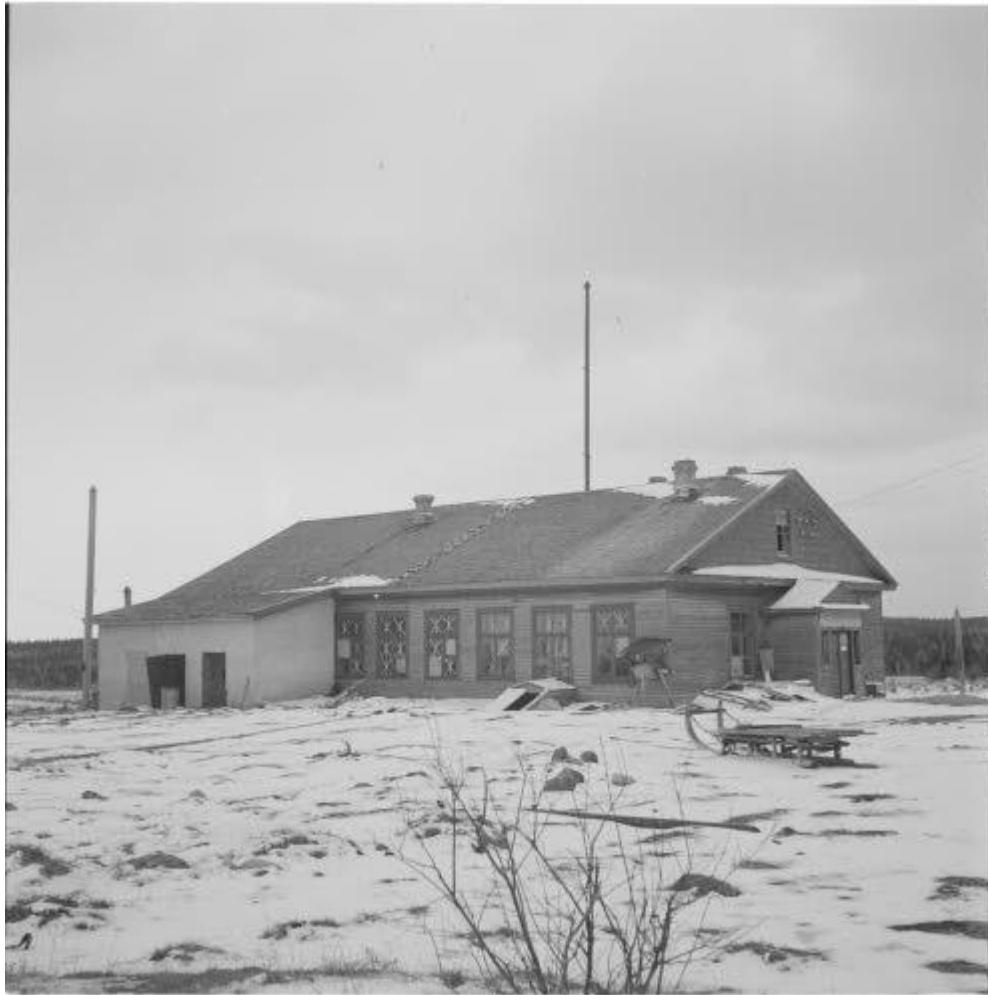
Kuva Aunuksen radiosta: Radioasema ulkoa.