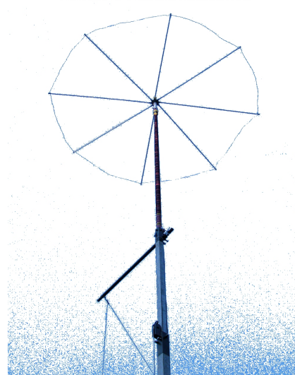
Black Arrow helical antenna 2009

Naisilla on mahdollisuus saunoa lauantaina klo 17-19 villatiloissa. Vuoron järjestäjänä toimii Ritva Honkola, kiinnostuneet voivat ottaa yhteyttä Ritvaan puh 050 5426261.