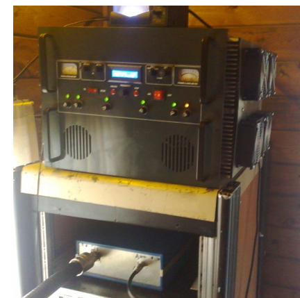
Radio Sterrekijker vuonna 2012. Asema toimii nykyään laillisesti taajuudella 1395 kHz.